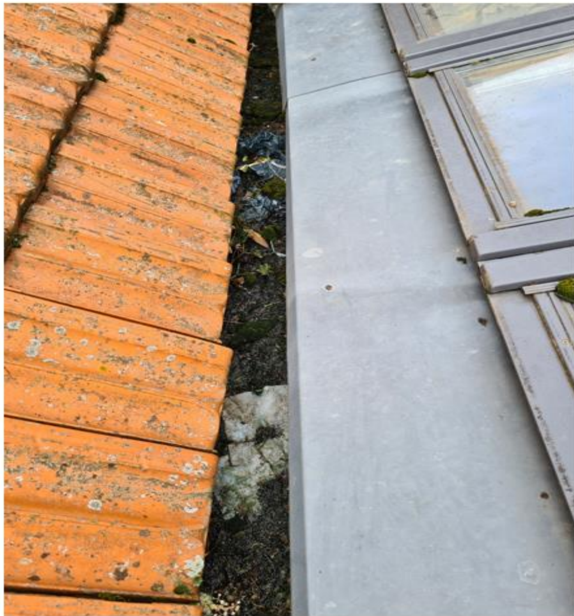
Espace où l'eau s'infiltré entre les deux toitures