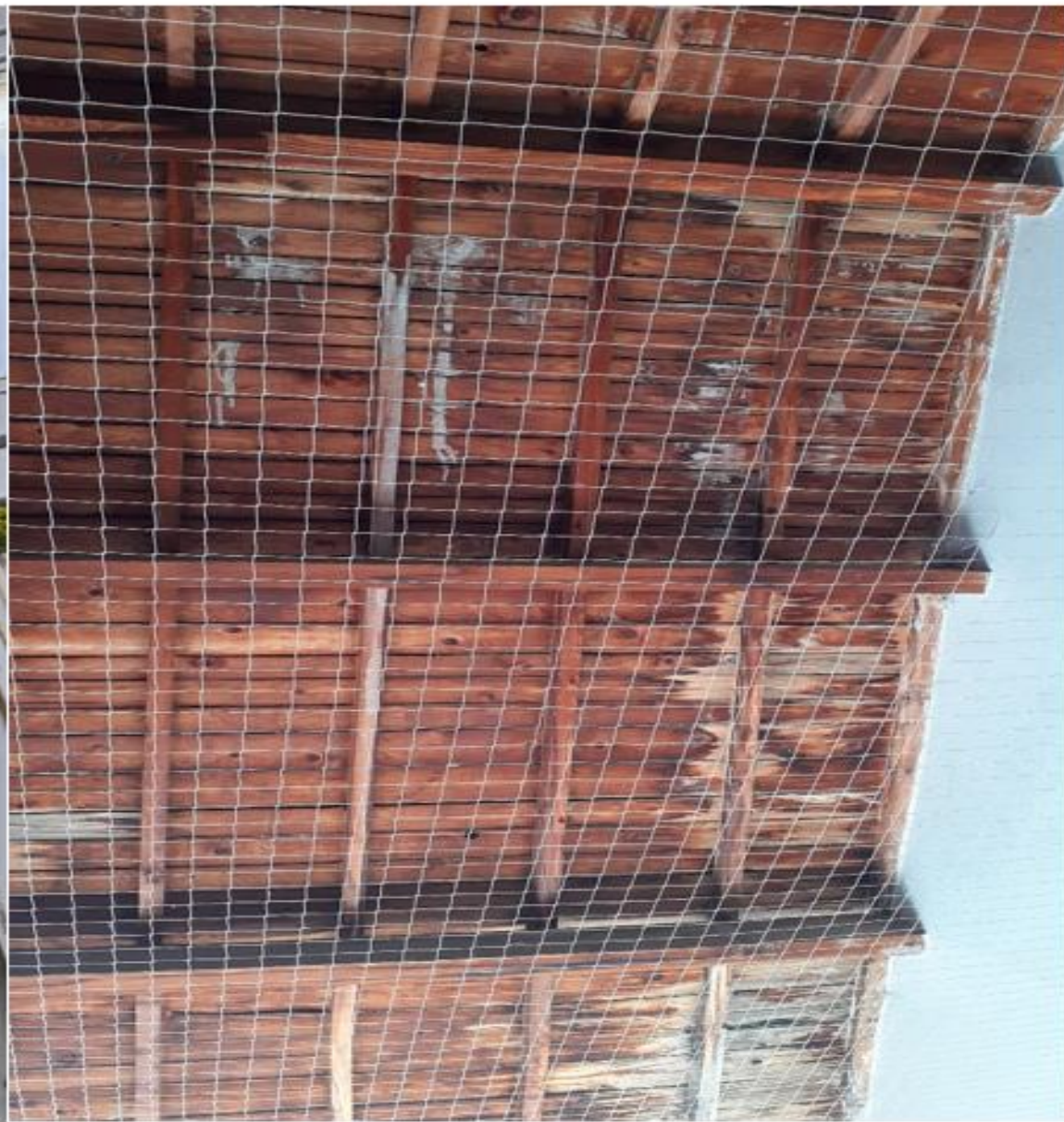
Infiltration toiture préau